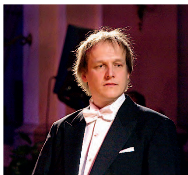
MAESTRO Matthias Manasi

Manasi ha saputo imprimere alla delicata opera wagneriana quell'aria di affettuoso trasporto che le compete, sfumando con grande sensibilità le sonorità degli archi verso trasparenze suggestive; nella Sinfonia di Schumann invece, con accorta scelta ha inteso sottolineare eloquentemente l'essenza che fa dell'opera la più «personale» del compositore, esaltando le frasi incisive, la varietà ritmica e le finezze timbriche. Una visione affascinante realizzata con dovizia di particolari, grazie all'impegno sincero dell'orchestra.